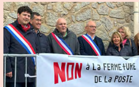
Manifestation contre la fermeture de la Poste de Donges en 2023 aux côtés de 200 habitants.

A l'initiative de mon groupe parlementaire, l'Assemblée nationale a adopté le 30 novembre une proposition de loi LFI garantissant un accès physique aux services publics . Face à une dématérialisation croissante, je me bats pour le maintien de services publics de proximité et humains (carte grise, carte d'identité, la Poste...). Chaque citoyen doit se voir proposer une alternative au numérique. Le texte doit désormais être voté au Sénat pour s'appliquer.