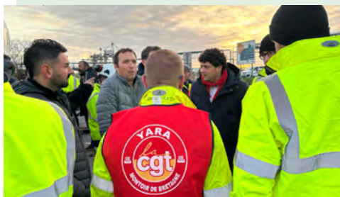
A la rencontre des salariés lors du rassemblement contre le plan de licenciement le 22 novembre.

La direction de l'entreprise Yara a annoncé l'arrêt de la production d'engrais du site de Montoir et le licenciement de 139 salariés . Après avoir méprisé les riverains, élus et l'Etat en refusant de mettre aux normes l'usine, Yara fait le choix de la casse sociale et industrielle plutôt que du respect des salariés et de la bifurcation écologique. En soutien aux salariés, j'ai interpellé le ministre de l'Industrie . Il est du devoir de l'Etat de se placer du côté des salariés afin de construire un projet alternatif, pourvoyeur d'emploi et répondant aux impératifs écologiques, industriels et sociaux de notre pays.